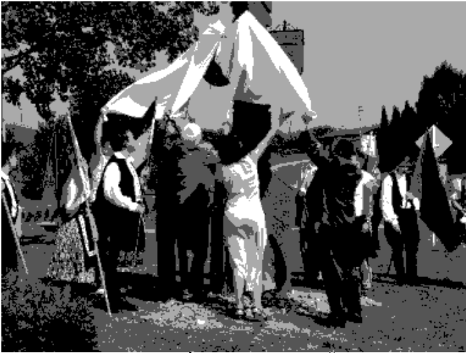
odhalenie pamätné stĺpu v parku Sv. Štefana

- v rámci projektu „Európa pre občanov „ bolo vybudované oplotenie pred domom ľudových tradícií, drevená vchodová brána k budove materskej školy, pamätný stĺp v parku Sv. Štefana, prístrešok nad pieskoviskom v areáli MŠ, spolu v hodnote 14.992,- €.