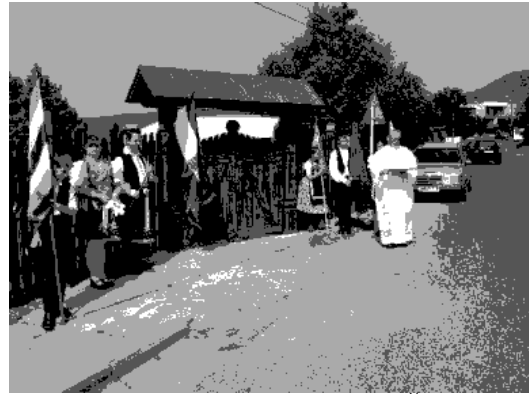
Vysvätenie novej brány MŠ