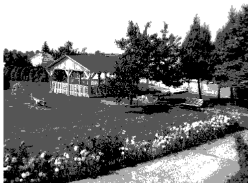
nové pieskovisko MŠ